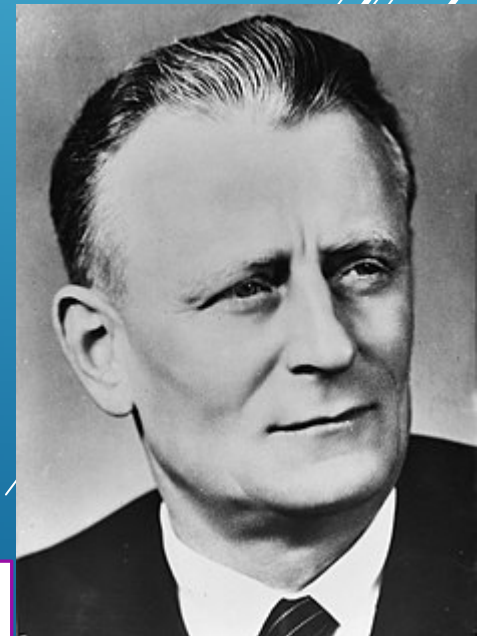
Antonín Novotný = ČSSR prezident