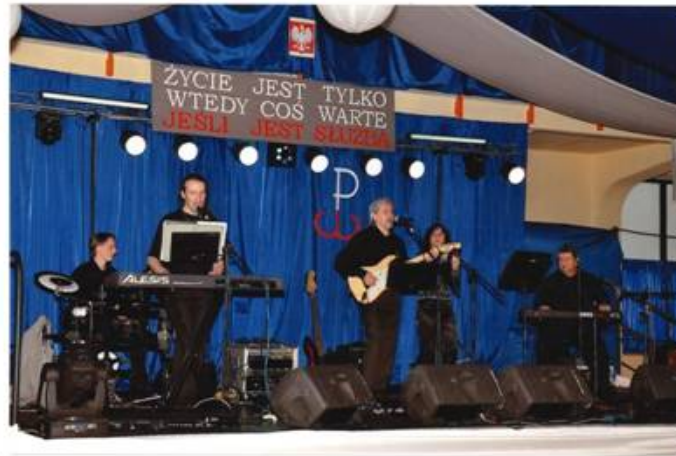
Do tańca i zabawy przygrywał zespół muzyczny Black and White.