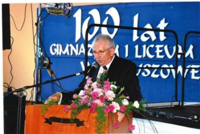
Pan Józef Kardys - Starosta Kolbuszowski