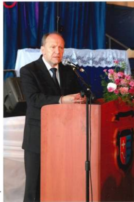
Pan Ligniew Chmielowiec - poseł na Sejm Rzeczypospolitej Polskiej