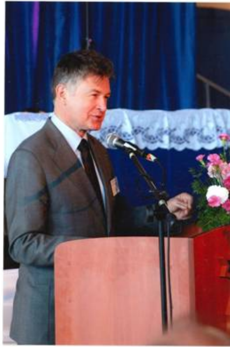
Pan Marian Krzaklewski