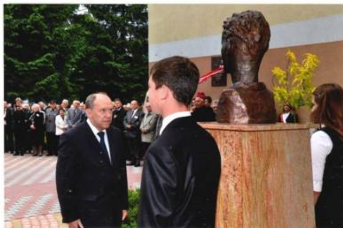
Posel na Sejm RP Pan Zbigniew Chmielowiec